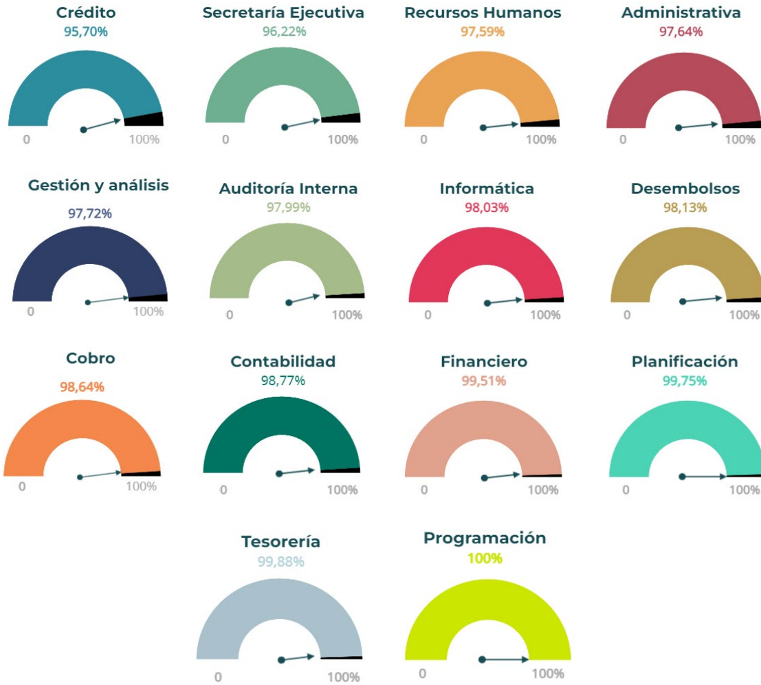
Resultados promedio por familias de puestos