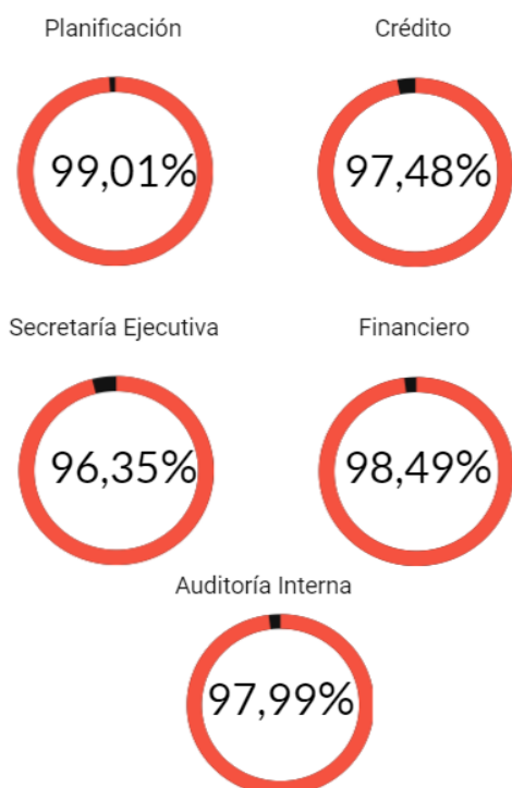
Grafico 1: Resultados promedio por departamento